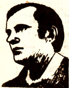
KSIĄDZ JERZY POPIELUSZKO