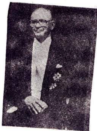
PREZYDENT RP. KAZIMIERZ SABBAT

Każda działalność publiczna oprócz podłoża ideowego musi mieć formę oraz strukturę organizacyjną. Walka o wolność i niepodległość naszego, zniewolonego przez przemoc sowiecką, narodu musi być prowadzona na obczyźnie przez polityczną emigrację niepodległościową. Naród w Kraju nie ma możliwości oficjalnego wypowiedzenia swych pragnień i dążeń. Tę rolę musiała przejąć emigracja i będzie ją kontynuowała aż do zwycięskiego końca, to jest uzyskania wolności i niepodległości. Polska emigracja niepodległościowa jest jedyną w świecie, która w oparciu o konstytucję swojego własnego kraju / Ustawa Konstytucyjna z dnia 23 kwietnia 1935r. / powołuje się na legalizm, to jest ciągłość władz i organów suwerennego państwa polskiego z Prezydentem Rzeczypospolitej Polskiej na